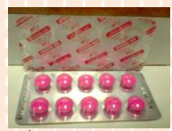
ยาไอบูโพรเฟน