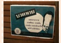
ยาบรรเทา