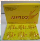
แอนพัสต์