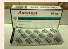
อะค็อกเซีย (Arcoxia)