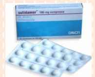
ซูลิดาเมอร์ (Sulidamor)