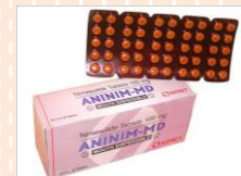
อะนิม-เอ็มดี (Anim - MD)