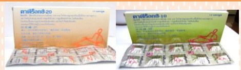
คาปิร็อกซ์ (CAPIROX)