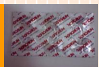
ยาไอบูโพรเฟน