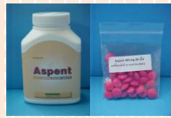
ยาแอสไพริน (Aspirin)