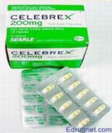
ซีลีเบร็กซ์ (Celebrex)