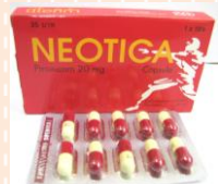
นีโอติกา (Neotica)