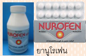
ยานูโรเฟน