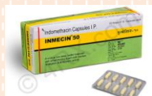
อินมีซิน (Inmecin)