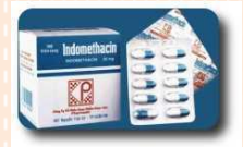
อินโดซิน (Indocin)