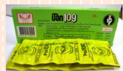
ป็อก 109 (POX 109)