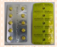
ไดโครฟีเนค (DICLOFENAC 25)