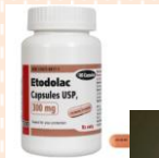
อีโทโดแลค (Etodolac)