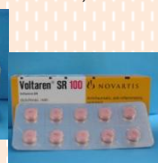
โวลทาเร็น (Voltaren)