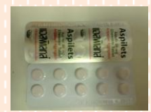
ยาแอสไพริน