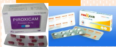
ไพโรคซิแคม (Piroxicam)