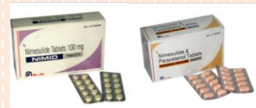
นิมิซูลาย (Nimesulide)