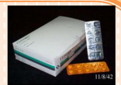
ซูลินเดค (Sulindac)