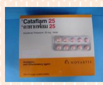
คาทาเฟลัม (Cataflam)