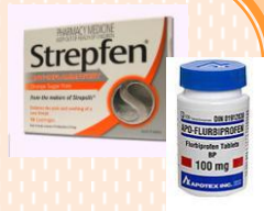
ยาสเตริพเฟน (Strepfen)