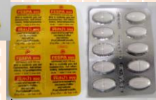
ฟีสปา (FESPA 500)