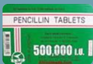
เพน-วี (Penicillin V)