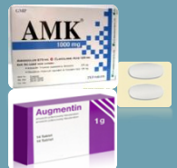
โค-อะม็อกซิคลาฟ (CO-Amoxiclav)

ดังนั้นผู้ที่เคยแพ้ยาควรแจ้งประวัติแพ้ยาทุกครั้งก่อนรับยา