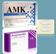
โค-อะม็อกซิคลาฟ (CO-Amoxiclav)

ดังนั้นผู้ที่เคยแพ้ยาควรแจ้งประวัติแพ้ยาทุกครั้งก่อนรับยา