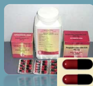
แอมพิซิลลิน (Ampicillin)