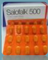
ซาโลฟลอก (Salofalk)