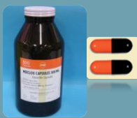
คล็อกซาซิลลิน (Cloxacillin)