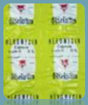
ฮีโร่เอ็มยซิน (Heromycin)