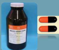
คล็อกซาซิลลิน (Cloxacillin)