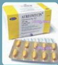
ออริโอเอ็มยซิน (Aureomycin)